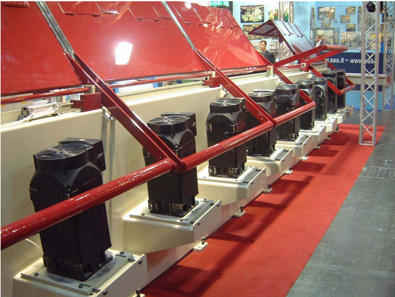
Máquina equipada con motores asíncronos vectoriales Powertech DriveAX