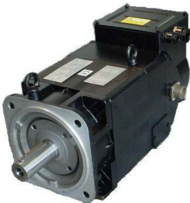
Powertech DriveAX (IP54)

Los llamados motores vectoriales, como los DriveAX (IP54) y Tetravec (IP23) de la familia Powertech , fabricados por Comer , han sido concebidos y fabricados teniendo presente su utilización con variadores de frecuencia.